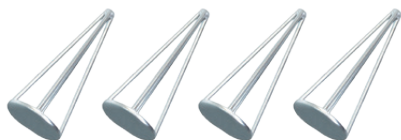
Art. 06500800 | Kit 4 coni per cerchi Kit 4 cones for car rims