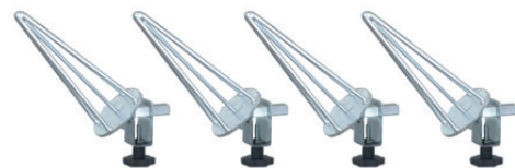
Art. 06500850 | Kit 4 coni per cerchi con supporti isolati Kit 4 cones and supports for car rims